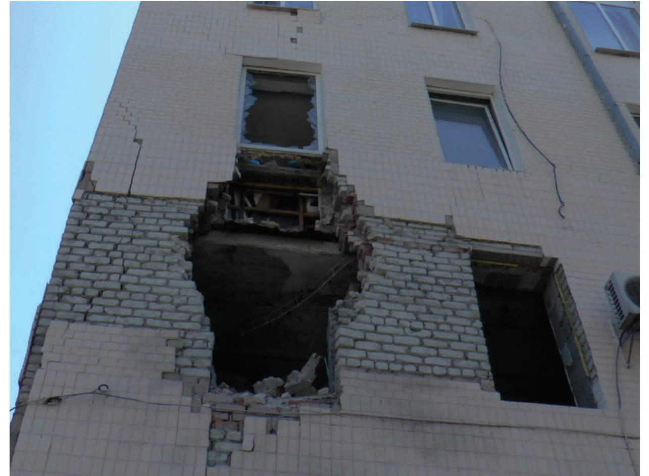
The accommodation building which was damaged by the artillery shelling of Ukrainian Armed Forces.

ЛНР, г. Луганск, июль 2014 года.