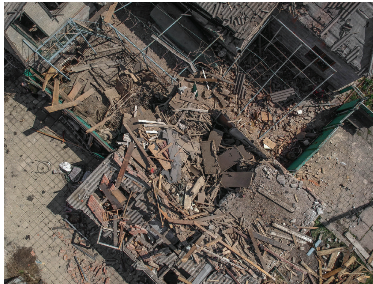
The household building, the garage and the accommodation unit destroyed by the 122 mm caliber artillery shell of the Ukrainian Armed Forces. Village Staromikhailovka, April 2018.