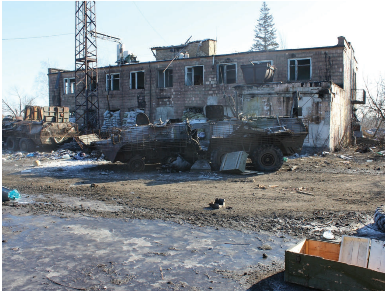
The destroyed military equipment of Ukrainian Armed Force.

LPR, the city of Debaltsevo, February 2015.