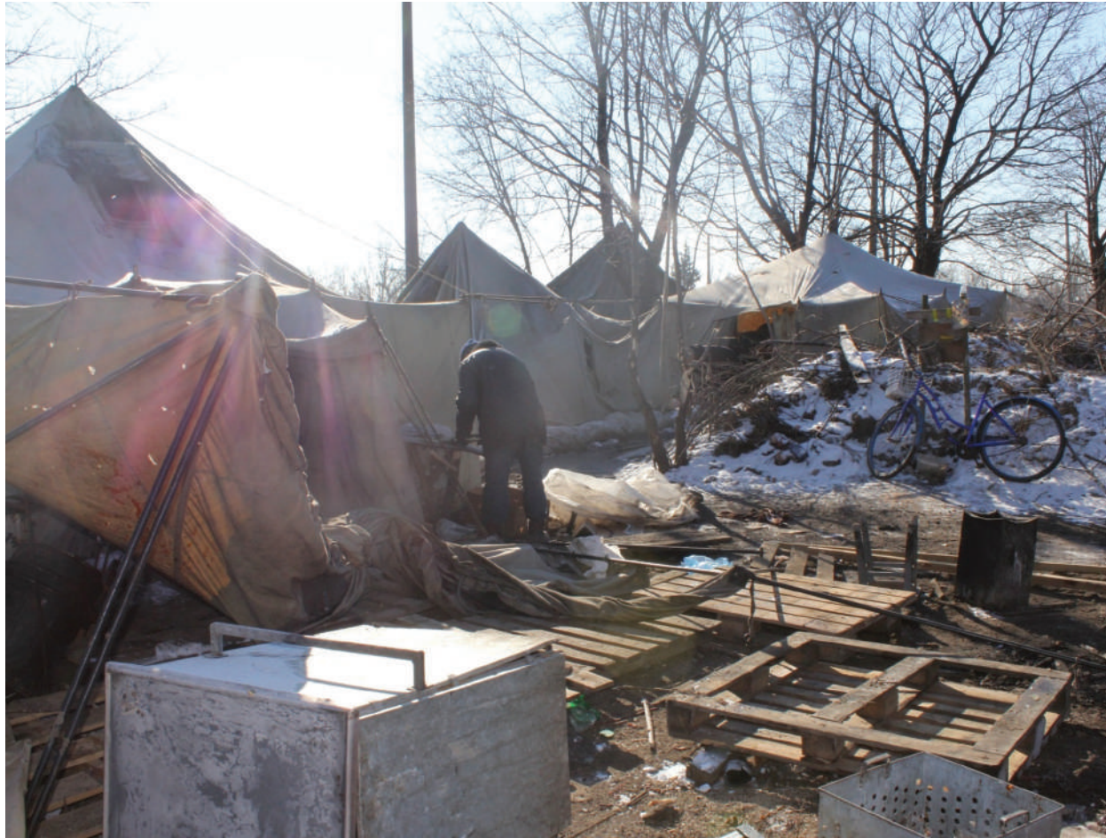
The tent camp for the city residents.

LPR, the city of Debaltsevo, February 2015.