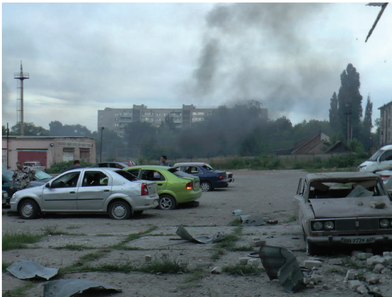
The artillery shelling from Ukrainian Armed Forces.

LPR, The city of Lugansk, July 2014.