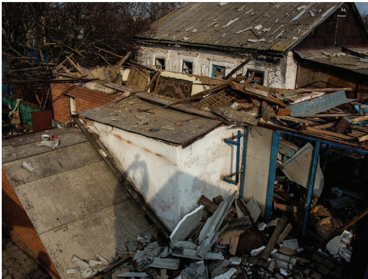
The consequences of mortar shelling. Village Kominternovo, March 2018.