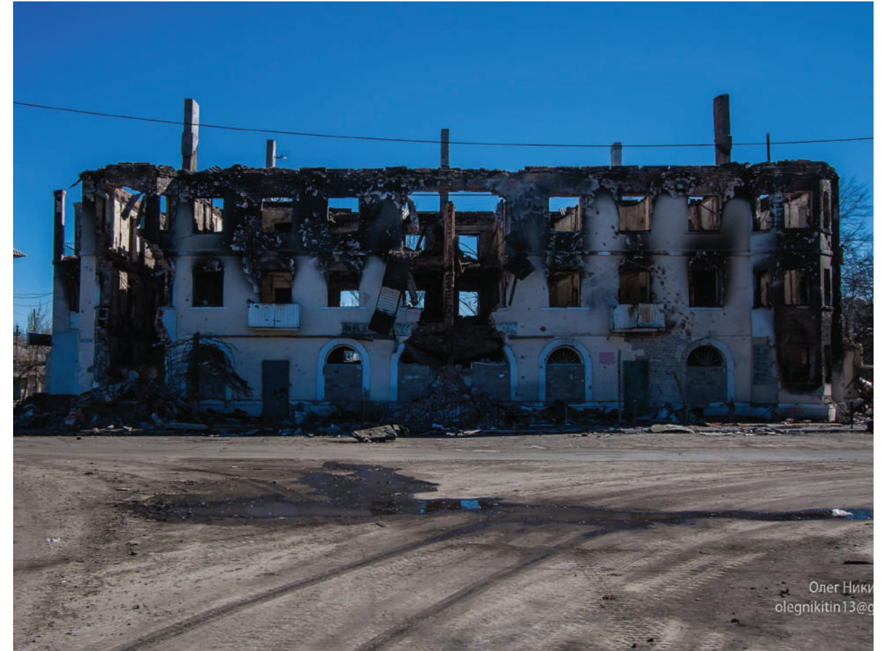
The building in Uglegorsk central square, it was burnt by the Ukrainian Armed Forces during their retreat. That was used as the Ukrainian Armed Forces' headquarter.