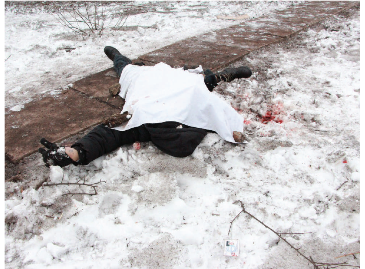
The civilian was killed at the Kirovsk hospital's territory as a result of the Ukrainian Armed Forces' shelling.

ЛНР, п. Калиново, январь 2017 года.