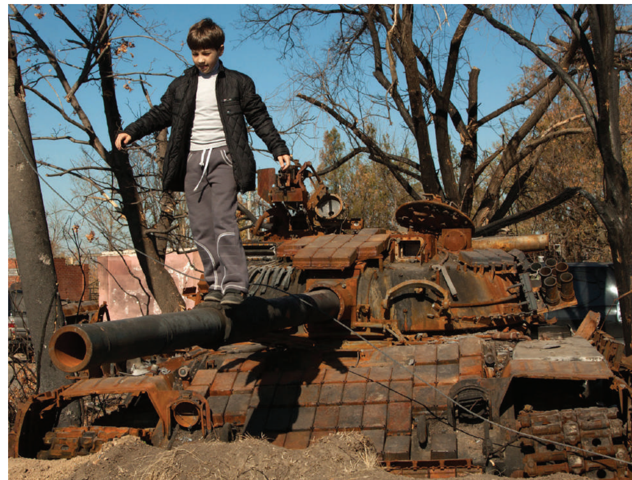
The boy on the burnt T-72 tank.

ЛНР, п. Новосветловка, октябрь 2014 года.