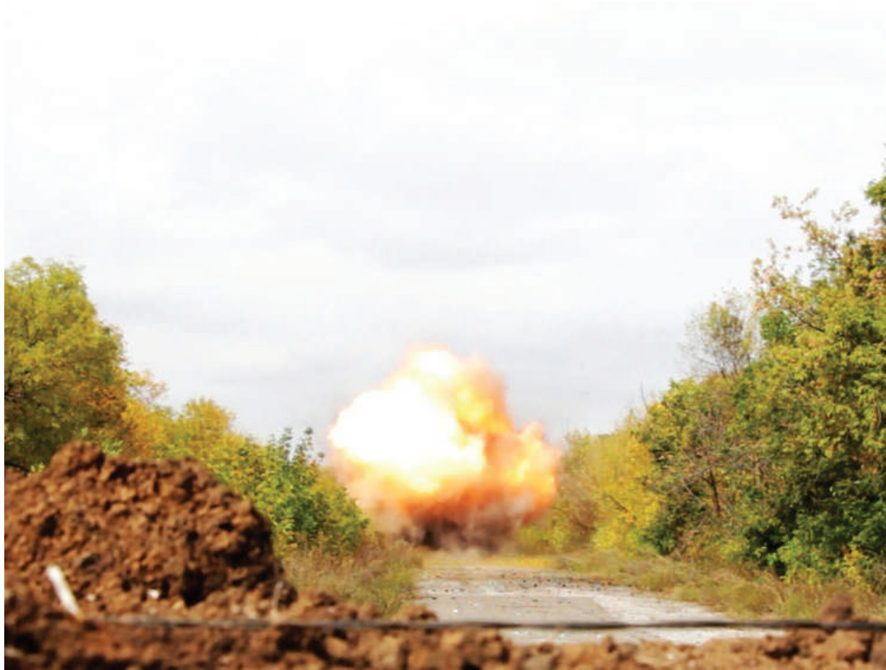
The explosion of the Ukrainian Armed Forces' mine defense.

LPR, the city of Pervomaysk, September 2016.