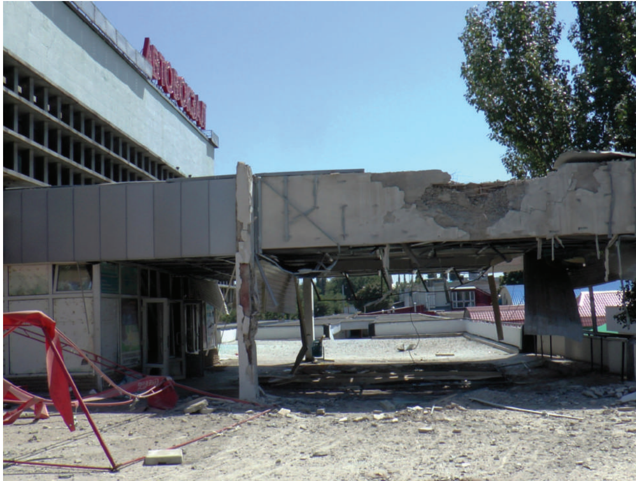
The Lugansk bus terminal after the artillery shelling of Ukrainian Armed Forces.

LPR, The city of Lugansk, July 2014.