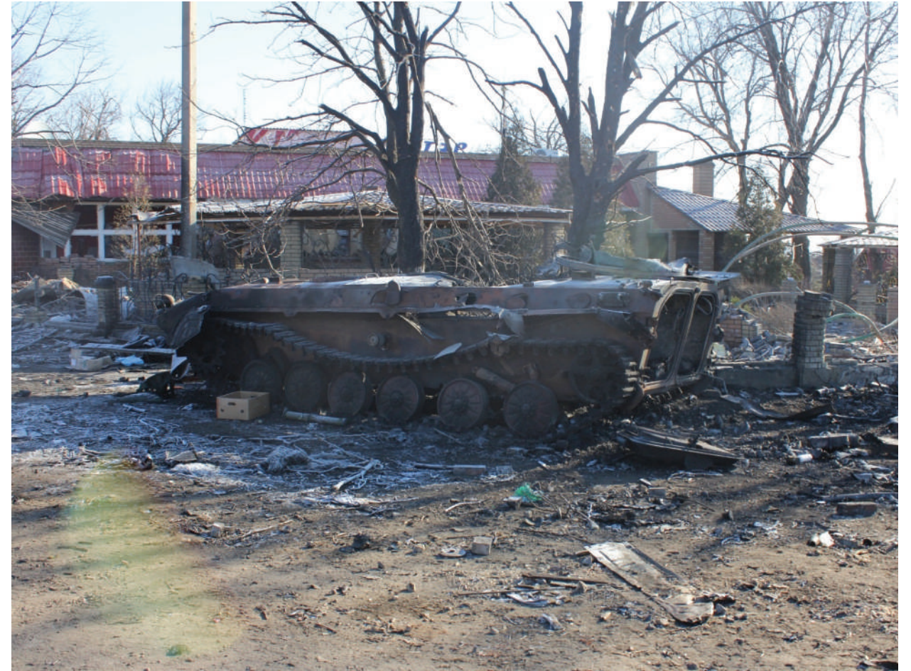
The destroyed military equipment of Ukrainian Armed Force.

ДНР, г. Дебальцево, февраль 2015 года.