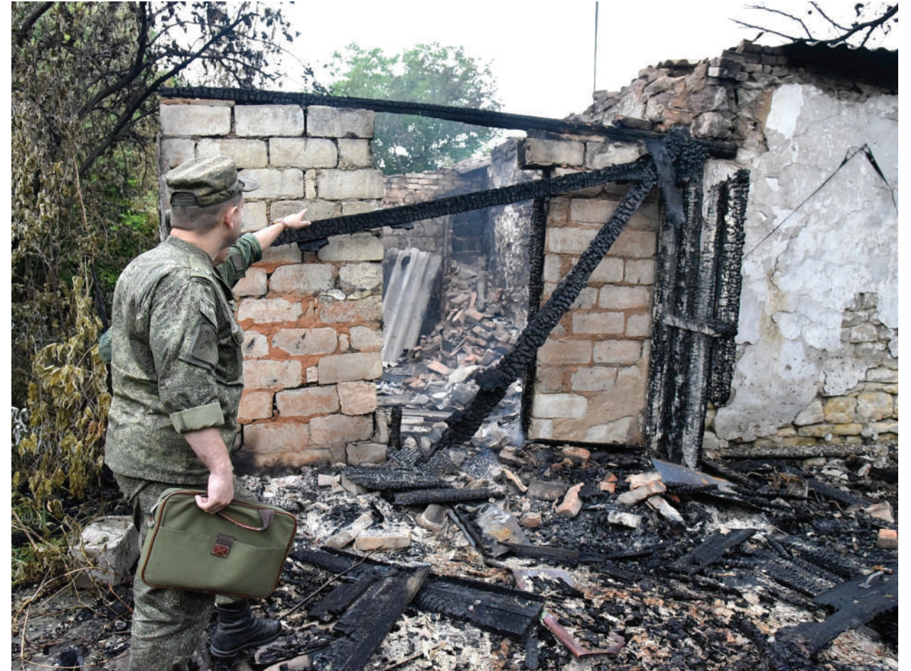
The house was burnt due to the hit of the Ukrainian Armed Forces' artillery shelling.

ЛНР, Кировск, июнь 2017 года.