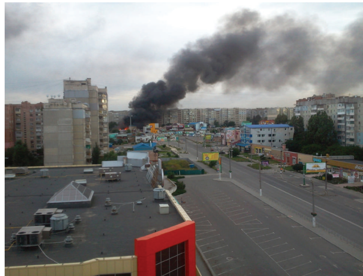
The artillery shelling of Ukraine troops to Lugansk city center.

ЛНР, г. Луганск, июль 2014 года.