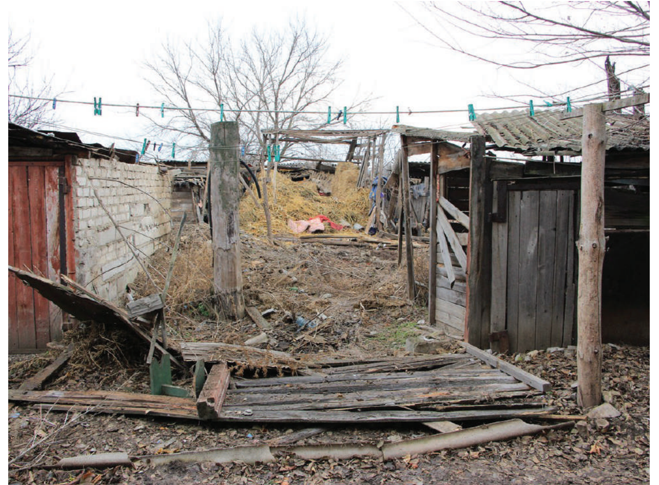
The yard of house which was destroyed by the mortar shelling of Ukrainian Armed Forces.

ЛНР, г. Первомайск, сентябрь 2016 года.