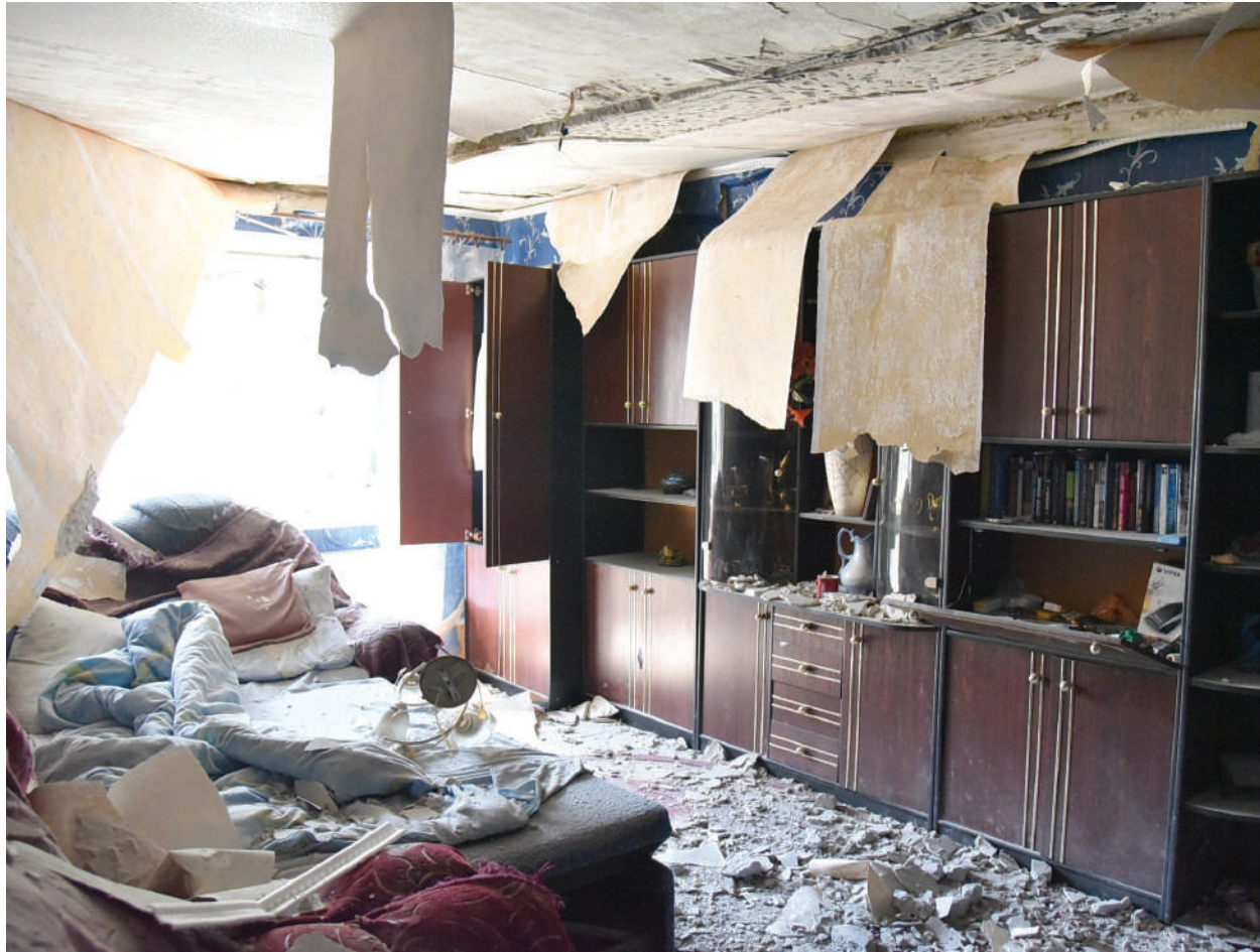
The apartment which was damaged by the mortar shelling of Ukrainian Armed Forces.

LPR, the city of Kirovsk, June 2017.