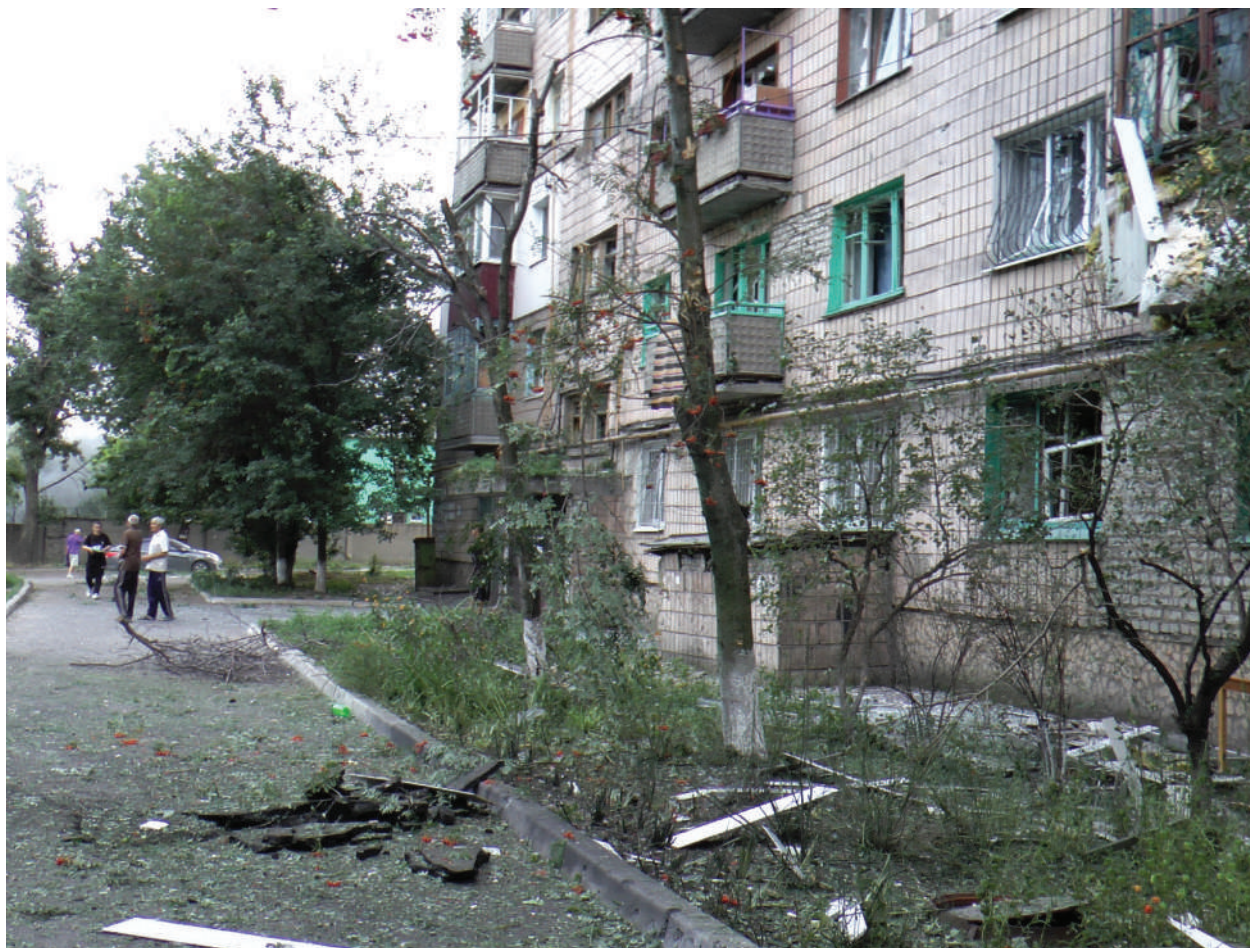
The result of the Ukrainian Armed Forces' artillery shelling.

LPR, The city of Lugansk, July 2014.