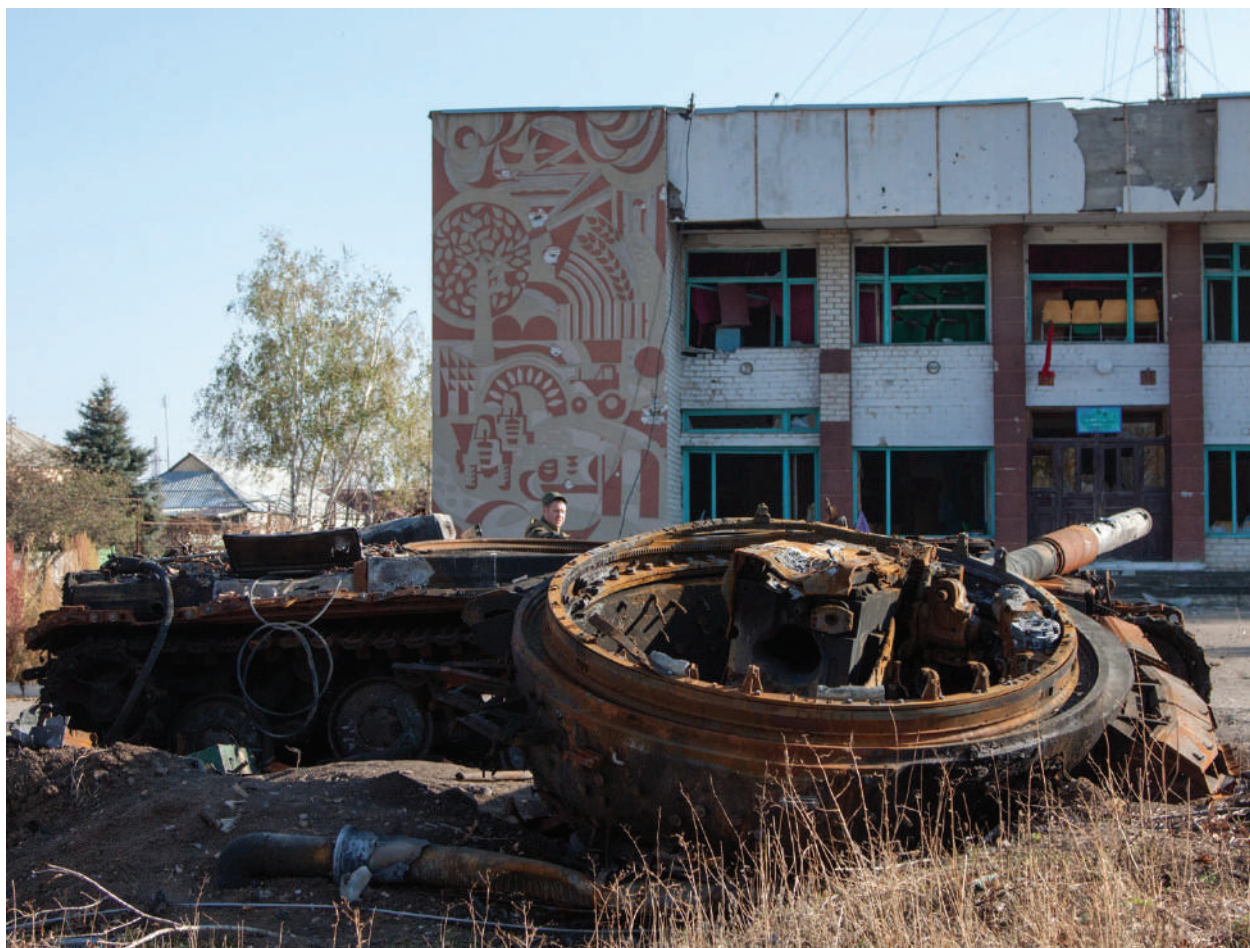
The turret of Ukrainian Armed Forces' T-64 tank was torn off.

LPR, Village Novosvetlovka, October 2014.