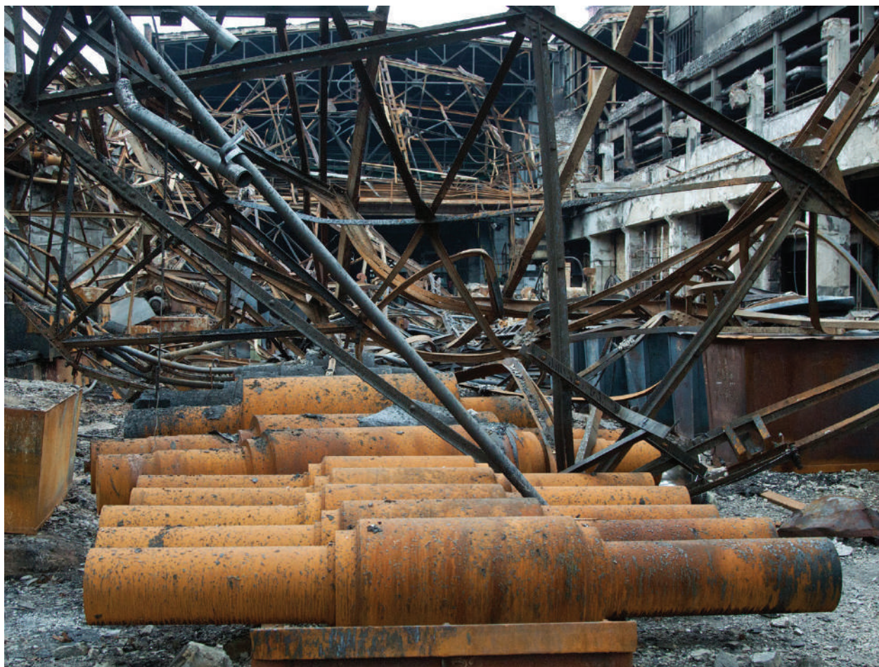
The roll factory after the artillery shelling of Ukrainian Armed Forces.

LPR, the city of Lugugino, October 2014.