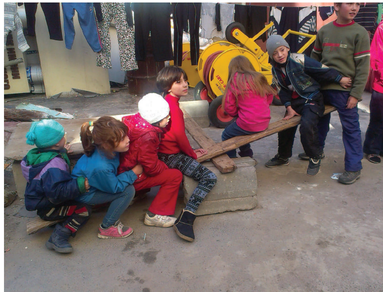
The children are using improvised seesaw near the bomb shelter where they regularly cover from the Ukrainian punishers' shelling.

ЛНР, г. Лутугино, октябрь 2014 года.