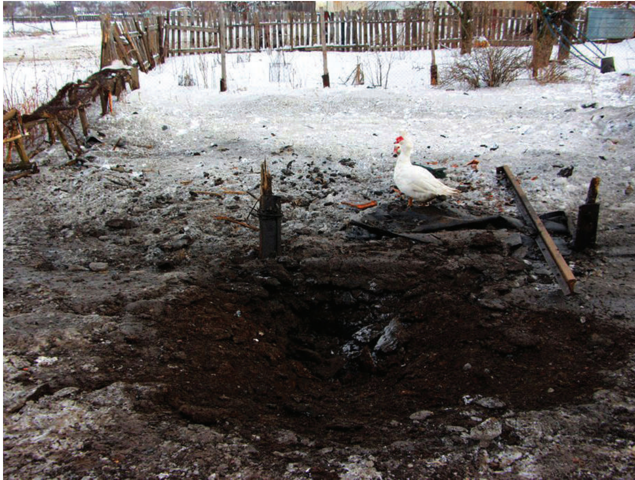
The crater of the mine which hit in the yard of the cottage.

LPR, village Kalinovo, January 2017.