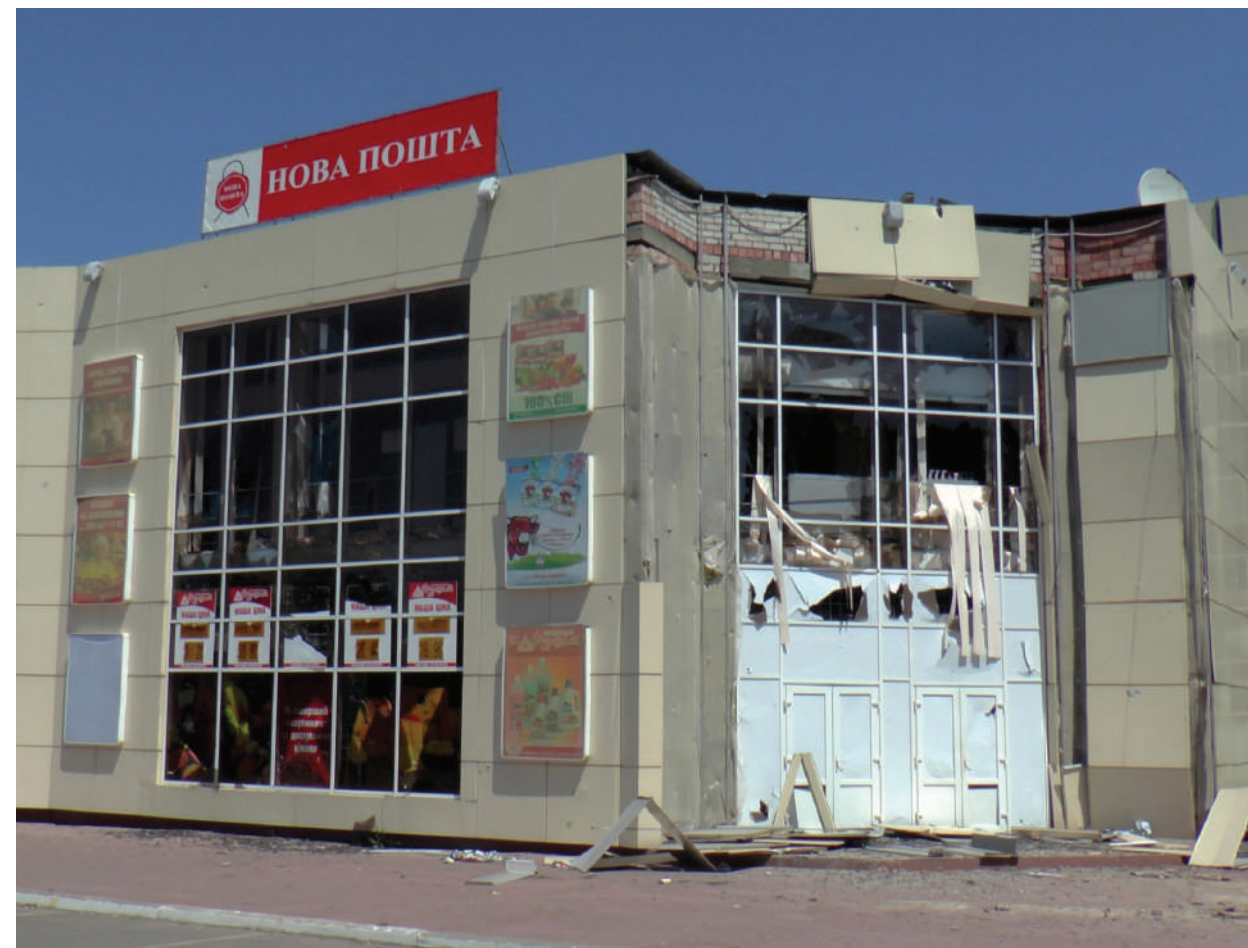
The shopping center "Furshet" after the artillery shelling of Ukrainian Armed Forces.

ЛНР, г. Луганск, июль 2014 года.